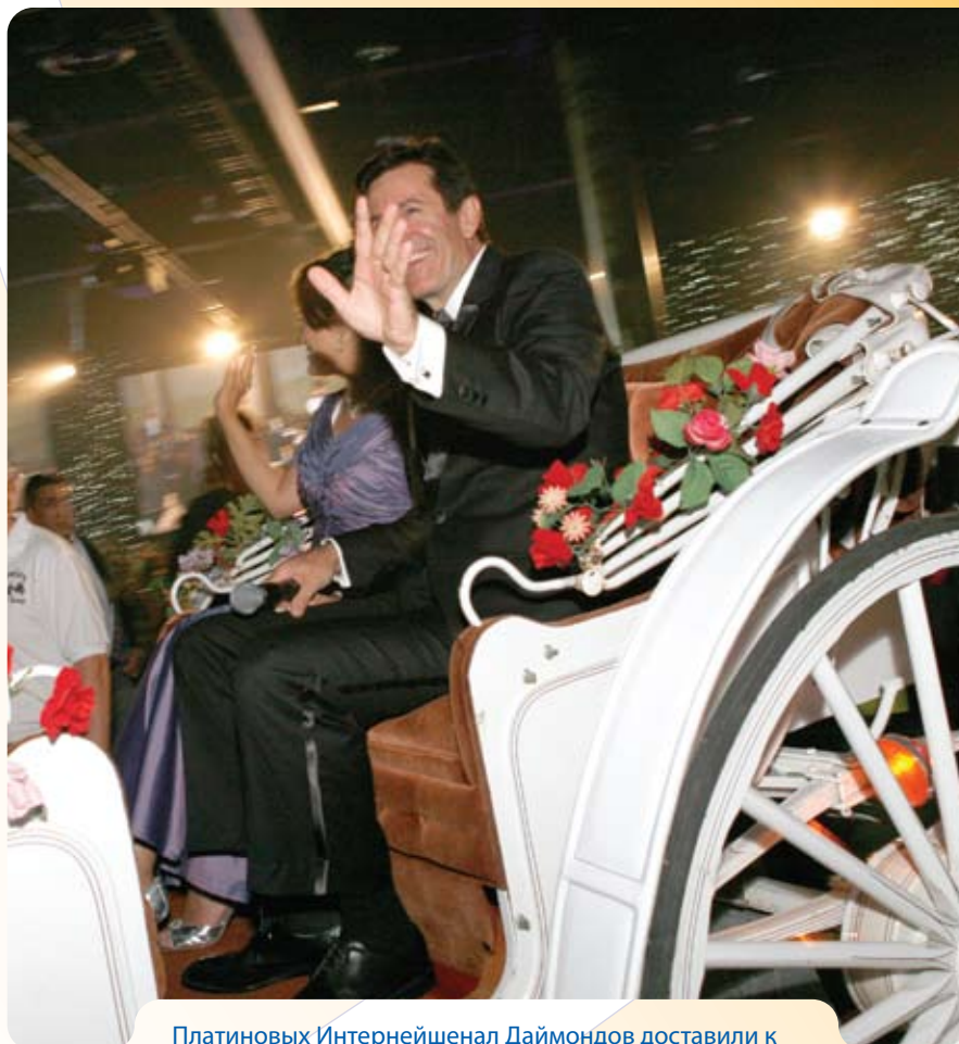
Платиновых Интернейшенал Даймондов доставили к самой сцене в каретах, запряженных лошадьми.