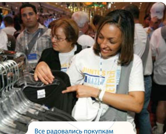
Все радовались покупкам в магазине illuminate '09.