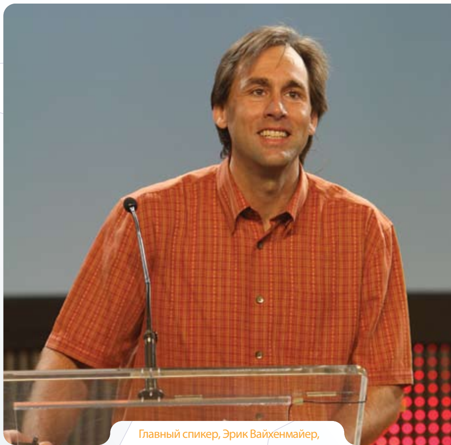
Главный спикер, Эрик Вайхенмайер, вдохновил публику.

Торжественная сессия III – Ралли Успеха – была наполнена энергией, вдохновением и энтузиазмом. Восемь дистрибьюторов 4Life делились с аудиторией секретами успеха. Многие дистрибьюторы вернулись домой с чудесными призами, а пятеро дистрибьюторов выиграли по $10 000! Но Конвенция еще не завершилась! Заключительная часть была наполнена весельем, танцами,