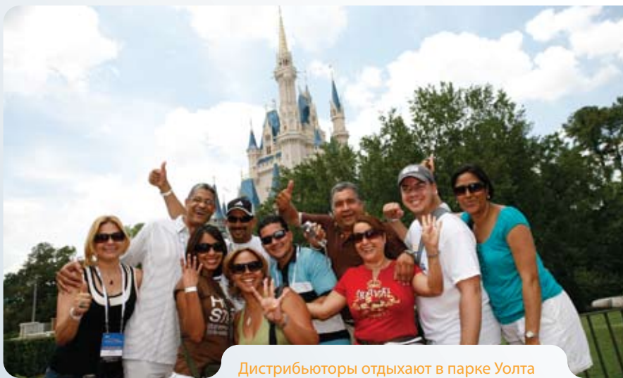
Дистрибьюторы отдыхают в парке Уолта Диснея.