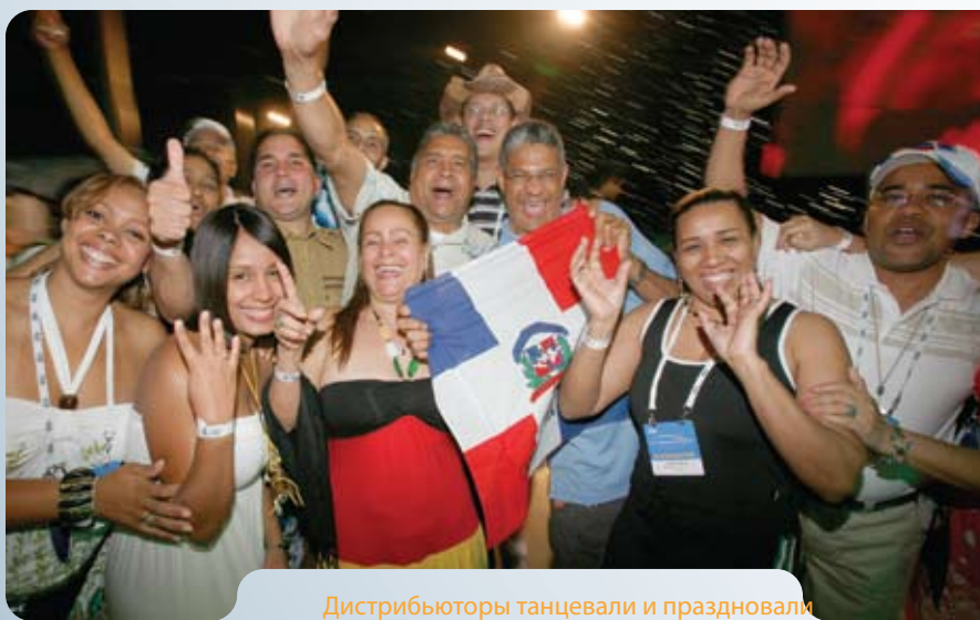
Дистрибьюторы танцевали и праздновали успех на заключительной вечеринке.

поздравлениями. Облаченные в пляжные костюмы 50-ых годов, дистрибьюторы веселились от души и делали снимки, чтобы навсегда запечатлить магию конвенции.